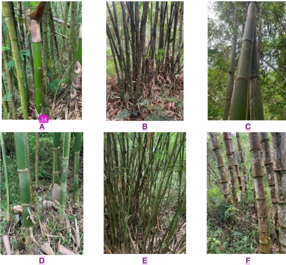
Gambar 1. Jenis-Jenis Bambu Yang Berada di Lokasi Penelitian

Keterangan : A = Bambu Ampel E = Bambu Pagar B = Bambu Apus F = Bambu petung C = Bambu Andong D = Bambu Legi