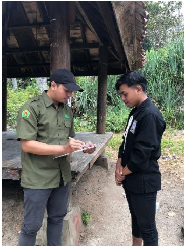
Gambar 3 Dokumentasi