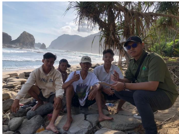
Gambar 6 Dokumentasi