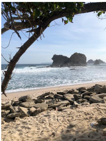
Gambar 4 Dokumentasi