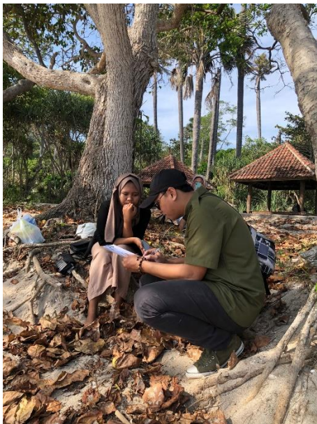
Gambar 7 Dokumentasi