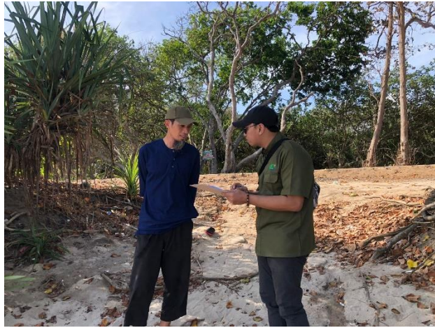
Gambar 2 Dokumentasi