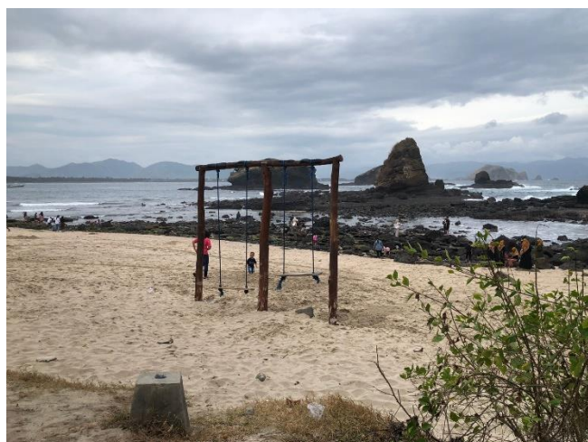
Gambar 5 Dokumentasi