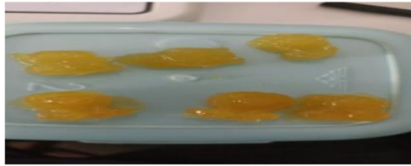
Gambar Permen Gummy Temumangga Dengan Penambahan Sari Nangka