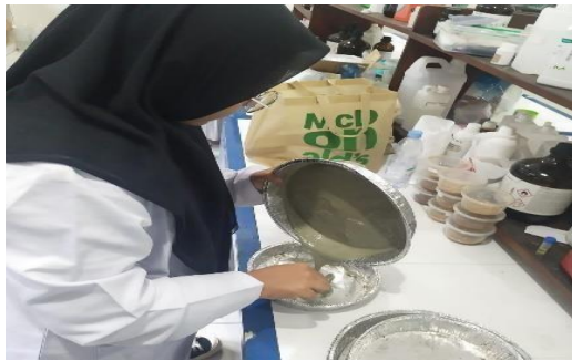
Gambar 6. Pembuatan enkapsulasi I