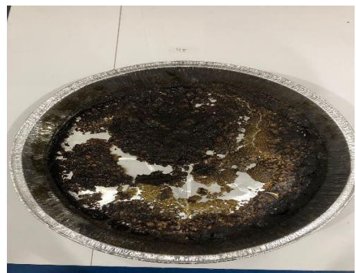
Gambar 15. Metode foam mat drying