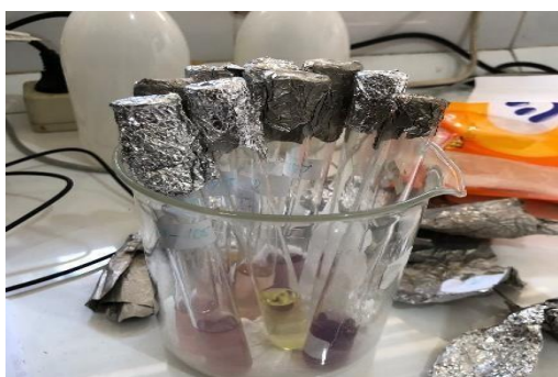
Gambar 12. Analisis antioksidan