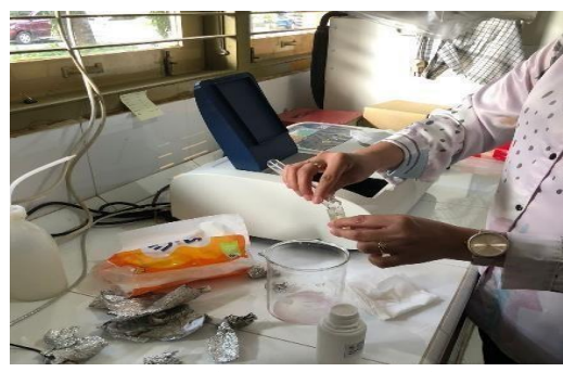
Gambar 13. Antioksidan spektrofotometer