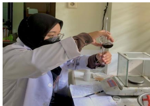
Gambar 11. Analisis aktivitas antioksidan