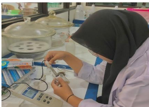
Gambar 10. Analisis pH