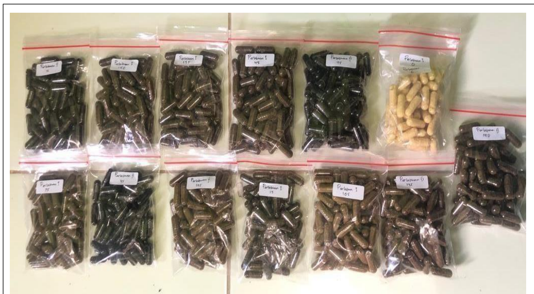
Gambar 16. Enkapsulasi daun sambiloto dan sereh