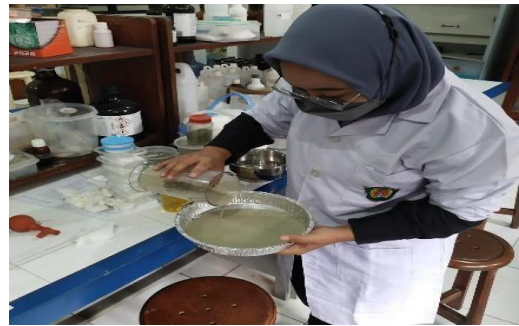
Gambar 7. Pembuatan enkapsulasi II