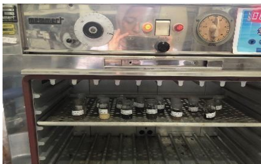
Gambar 8. Analisis kadar air