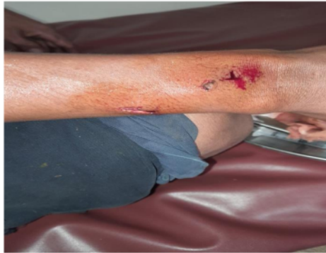
Gambar 3.4 Pemanen yang tertimpa TBS

D. Pemanen yang tertimpa TBS, dikarenakan ada SOP pelepasan songgo 1 (sesuai SOP; 13 pelepasan yang menopang berjumlah 8 buah atau "songgo satu", didefinisikan sebagai satu baris spiral dibawah buah) sehingga pemanen harus menyungkit TBS yang sudah didodos, sehingga jatuhnya TBS kadang tidak bisa diprediksi. SOP ini tidak berlaku pada semua PT tergantung dari kebijakan masing-masing PT, Cara yang aman saat mendodos TBS ialah dengan mengambil jarak tertentu agar tidak tepat dibawah TBS tetapi sedikit menyamping menyesuaikan panjang batang dodos.