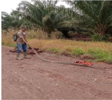
Gambar 1.4 Ular sanca

fokuskan terlebih dahulu terkait perawatan seperti melakukan penyemprotan guna mengendalikan gulma serta melakukan pruning secara merata setiap bloknnya serta membersihkan kebun dari sarang tawon berbahaya. Bila masalah-masalah diatas tidak diatasi tuntas, akan dapat mengakibatkan terjadinya kecelakaan kerja yang dapat merugikan pekerja dan perusahaan.