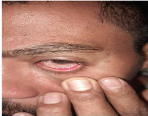
Gambar 3.6 Pemanen yang kelilipan serbuk saat memanen