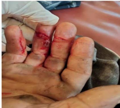
Gambar 3.2 Tangan Pemanen yang tersayat saat mengasah dodos