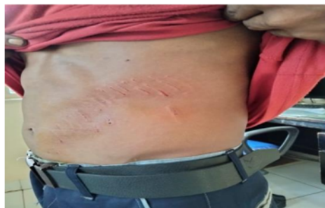
Gambar 3.5 Pemanen yang terpeleset

E. Saat mengeluarkan TBS menuju TPH, pemanen terpeleset di pasar pikul (pasar pikul adalah jalan untuk mengantar TBS yang sudah dipanen menuju TPH serta dipakai untuk memudahkan kegiatan pemeliharaan lainnya) hingga terjatuh menimpa gawangan mati dikarenakan pasar pikul licin dan pemanen tidak menggunakan sepatu boot. Untuk mengurangi/ meminimalisir cedera saat mengeluarkan TBS ialah menggunakan sepatu/ APD dan beban muatan pada angkong tidak melebihi batas.