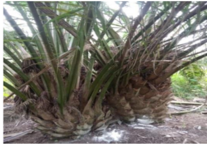
Gambar 1.3 kebun sawit yg jarang / belum dipruning

Pada kebun sawit (gambar 1.3) menunjukkan kondisi pokok yang tidak terawat atau belum dipruning. Hal ini dapat menyebabkan bersarangnya baik lebah maupun tawon dll. Meskipun ada insentif bagi karyawan yang bisa membersihkan sarang tawon, dalam jangka panjang sebaiknya kegiatan membersihkan sarang tawon menjadi sebuah jobdesk dalam perawatan tanaman guna mengendalikan perkembangan sarang tawon secara signifikan. Usulan untuk perbaikannya adalah