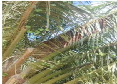
Gambar 1.2 Sarang Lebah

Selain tumbuhnya gulma lebat (semak belukar) pada sekitar pokok tanaman, seperti banyaknya sarang lebah dan tawon juga menjadi faktor bahaya yang perlu diwaspadai dan harus segera disingkirkan. Hal ini disebabkan kondisi kebun perawatannya tidak merata sehingga menyebabkan semak belukar, didukung pula oleh kondisi pokok tanaman sawit yang masih banyak belum di pruning, sehingga hal ini cukup merepotkan/ menyulitkan pemanen karena harus mengecek setiap ancak panennya dan tak sedikit pemanen yang tersengat tawon.