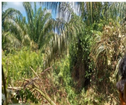
Gambar 1.1 Kondisi tanaman yang dipenuhi gulma lebat dan tinggi

Kondisi pertumbuhan gulma yang lebat dan tinggi disekitar pokok tanaman utama/ sawit akan dapat mempengaruhi pertumbuhan kelapa sawit karena dapat menyerap nutrisi dan air yang seharusnya digunakan oleh tanaman kelapa sawit. Sehingga mempersulit pekerja dalam melakukan proses panen, selain itu pertumbuhan gulma yang tinggi juga bisa menyebabkan hal-hal yang tidak diinginkan seperti ada ular, sarang lebah, sarang semut dan sebagainya. Oleh karena itu pentingnya melakukan perawatan pada tanaman kelapa sawit dengan cara melakukan penyemprotan herbisida untuk mematikan atau mengendalikan pertumbuhan gulma dan pruning.