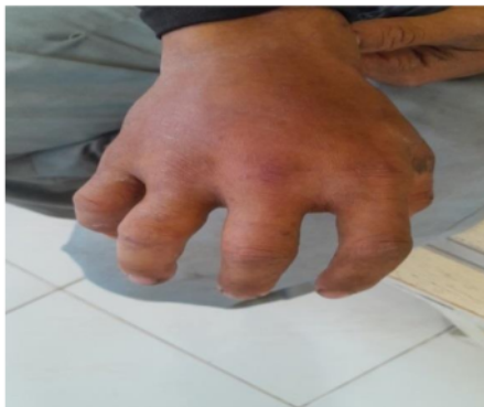
Gambar 3.3 Pemanen yang tersengat lebah