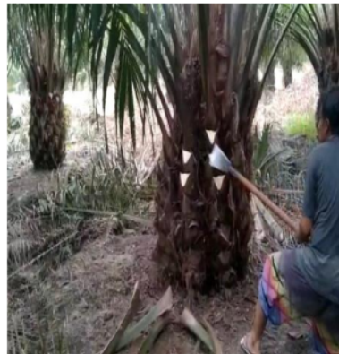
Gambar 2.1 Pemanen tidak menggunakan APD

Potensi bahaya yang mungkin bisa terjadi karena lingkungan yang tidak terawat, kondisi APD yang tidak memadai, metode atau cara kerja yang tidak sesuai SOP, hal ini yang harus ditegaskan agar dapat meminimalisir terjadinya kecelakaan kerja.