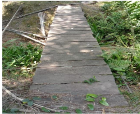
Gambar 2.2 titi panen yang kurang terawat

Masalah selanjutnya ada pada titi panen, jika sesuai SOP seharusnya titi panen terbuat dari beton kokoh yang berukuran lebar 25 cm, ketebalan 8-10 cm dan dengan panjang 3-4 meter menyesuaikan lebar parit. Namun hal ini dirasa kurang worth it mengingat keuangannya karyawan, maka opsi lain untuk titi panen bisa dibuat dari papan kayu seperti pada gambar 4.6.