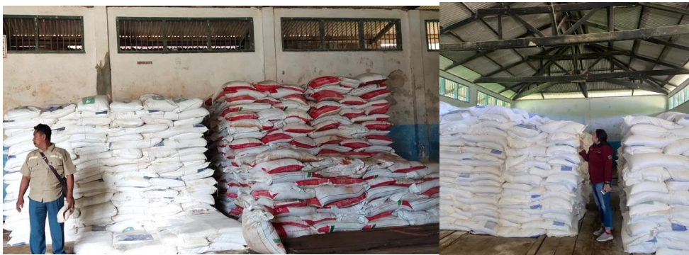
Gambar 5.3 Kondisi Penyimpanan Barang Di Gudang Kebun PT Surya Agrolika Reksa

Berikut ini kondisi penyimpanan barang di Gudang kebun PT. Surya Agrolika Reksa :