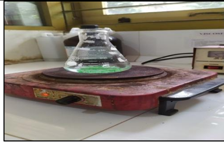
Proses Pemanasan Sampel dan Alkohol Netral (Analisis Asam Lemak Bebas)