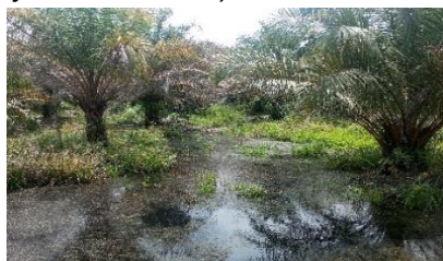
Gambar 2. Kondisi Pasar Pikul Blok Banjir

Berdasarkan data gambar 1, menunjukkan bahwa rata-rata aktual produktivitas pada blok masih berada dibawah trend budget produktivitasnya, khususnya blok banjir durasi lama dan durasi singkat. Adapun pengaruh yang terjadi terhadap selisih aktual dan budget produktivitas tersebut ialah disebabkan oleh karena adanya kondisi banjir pada blok tanaman kelapa sawit sehingga mengganggu penyerapan unsur hara tanaman kelapa sawit untuk mendukung perkembangan generatif, kualitas dan kuantitas produktivitas tanaman kelapa sawit. Selaras dengan pendapat Hidayat dkk (2013) ialah satu contoh keadaan lahan yang kurang sesuai untuk tanaman kelapa sawit ialah lahan yang mengalami cekaman kelebihan air dengan durasi waktu yang berbeda-beda sehingga memberikan dampak negatif terhadap pertumbuhan, perkembangan, dan produktivitas tanaman kelapa sawit. Maka dari itu, dengan membiarkan lahan mengalami cekaman kelebihan air maka akan memberikan dampak pada perbedaan fisiologi tanaman dan produksi tandan buah segar yang dihasilkan oleh tanaman kelapa sawit tersebut (Hidayat dkk, 2013).