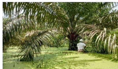
Gambar 3. Kondisi Piringan Blok Banjir