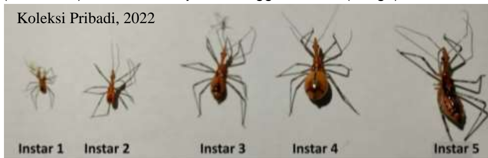
Gambar 1. Perkembangan instar nimfa S. dichotomus .

S. dichotomus merupakan salah satu serangga predator dari ordo Hemiptera, famili Reduviidae yang mengalami metamorfosis tidak sempurna (Hemimetabola) dimana ada 3 tahapan yang berbeda dalam 1 kali siklus hidup yaitu, Telur, nimfa dan Imago. Berdasarkan hasil penelitian yang telah dilakukan S. dichotomus yang diberikan pakan nimfa M. gilvus , larva H. illucens maupun kombinasi keduanya berpengaruh terhadap lamanya umur S. dichotomus (Fase Biologi) serta tingginya tingkat mortalitas S. dichotomus . Pengamatan dilakukan pada fase nimfa, dimana fase nimfa merupakan fase terlama dalam siklus hidup S. dichotomus , karena pada fase nimfa S. dichotomus mengalami 5 kali perubahan bentuk (instar) dimulai dari instar 1 sampai dengan instar 5 (Gambar 1), sebelum menjadi serangga dewasa (Imago).