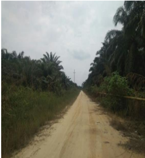
Jalan Koleksi (CR)