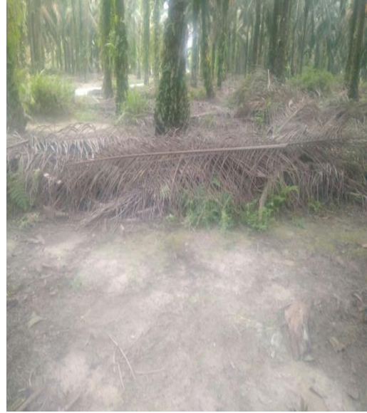
Gawangan Mati Petani Plasma