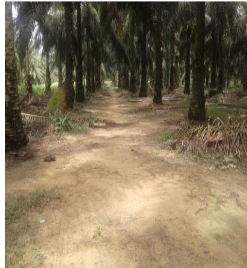
Pasar Pikul Petani Plasma