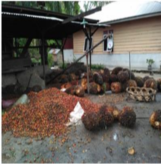
Hasil TBS Petani Swadaya di Tengkulak