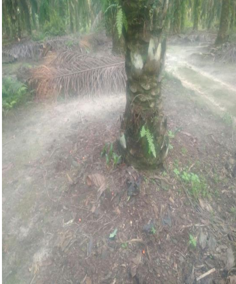
Piringan Petani Plasma