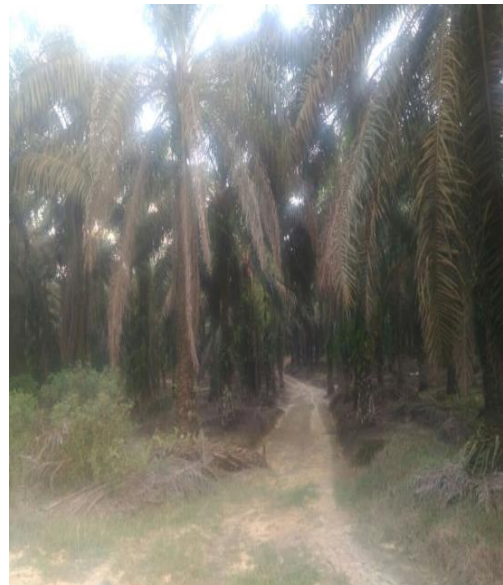
Jalan Koleksi (CR)