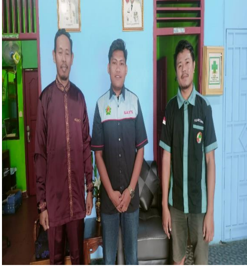
Izin Kepada Kepala KUD dan Asisten