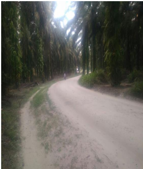
Jalan Utama (MR)