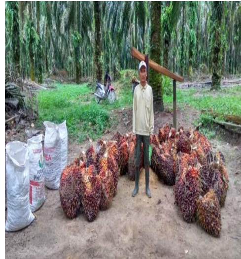
TPH Petani Swadaya