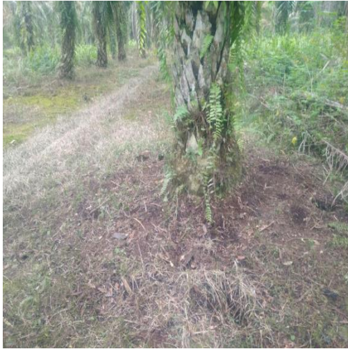
Piringan Petani Swadaya