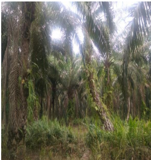
Kebun Petani Swadaya