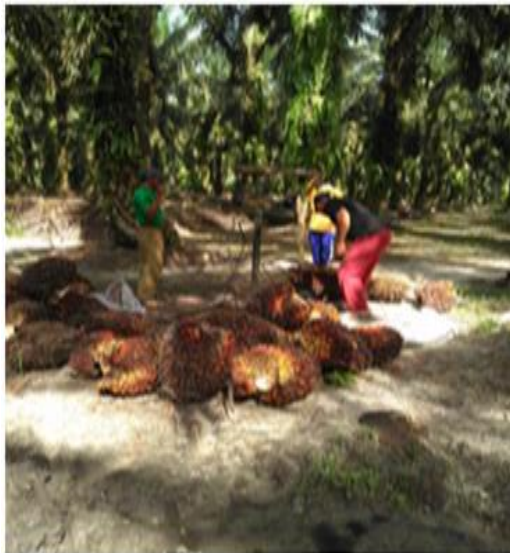
TPH Petani Plasma