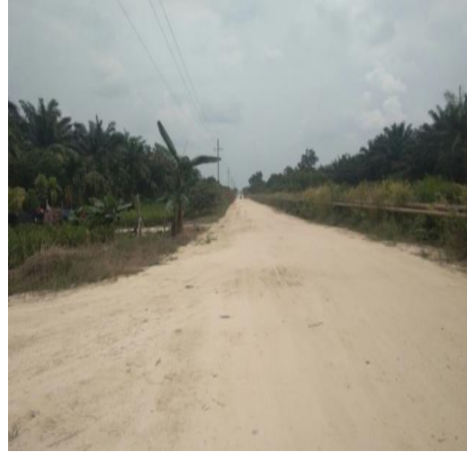
Jalan Utama (MR)