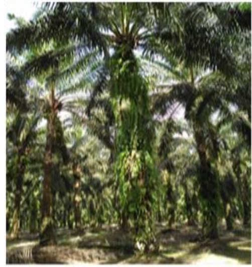
Kebun Petani Plasma