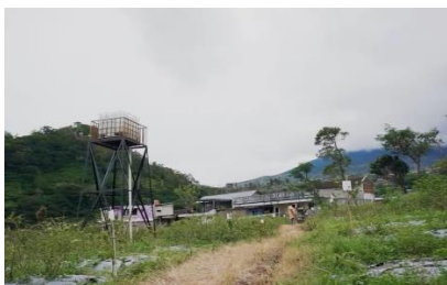
Landscape agroforestri 3