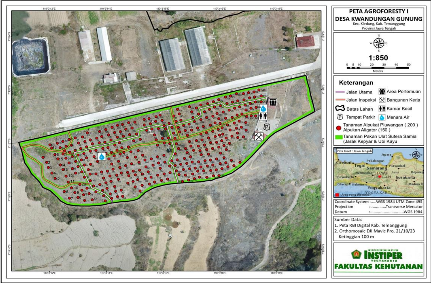
Lampiran 1. Peta Agroforestri 1