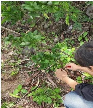
Tanaman jeruk keprok