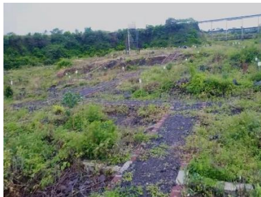
Landscape agroforestri 1