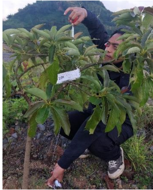
Pengukuran tinggi tanaman