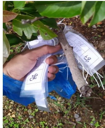
Pemasangan nomor dan nama tanaman