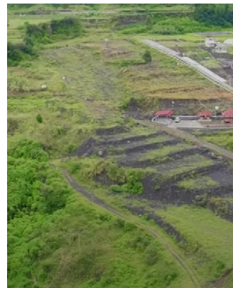
Tanaman di area Agroforestri