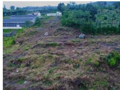
Landscape agroforestri 2