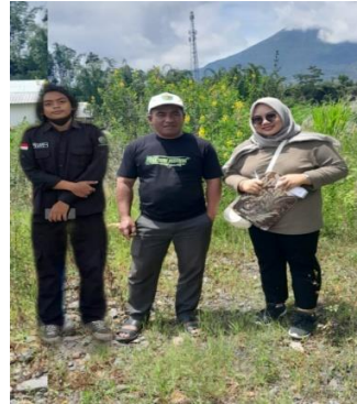
Dokumentasi bersama pengelola