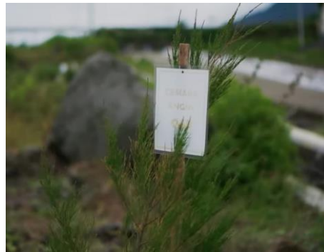
Tanaman cemara laut