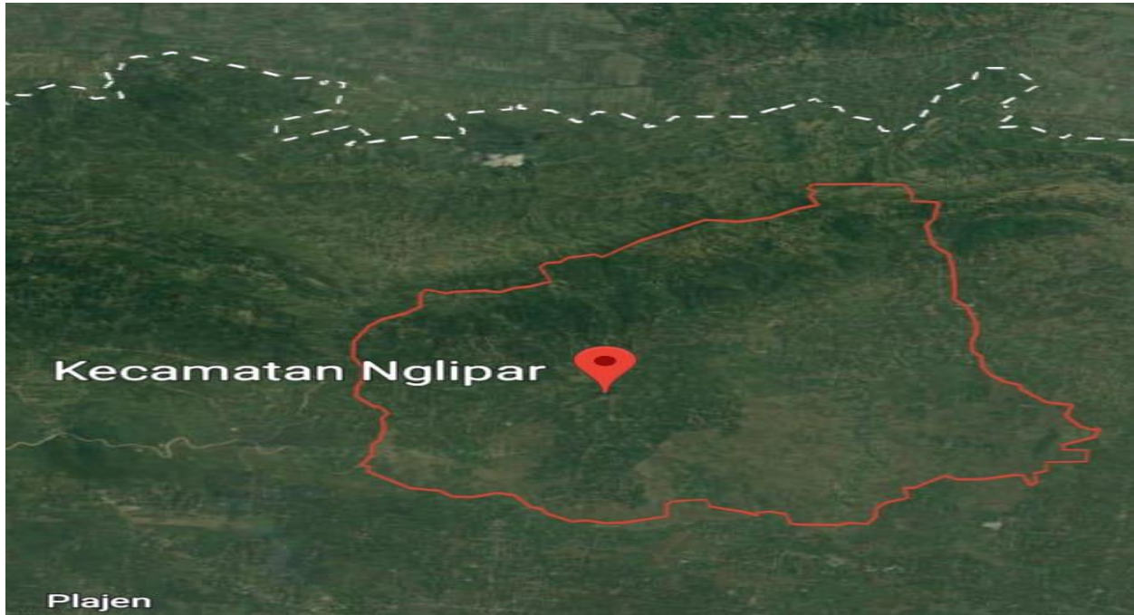
Gambar.2 Peta Kecamatan Nglipar