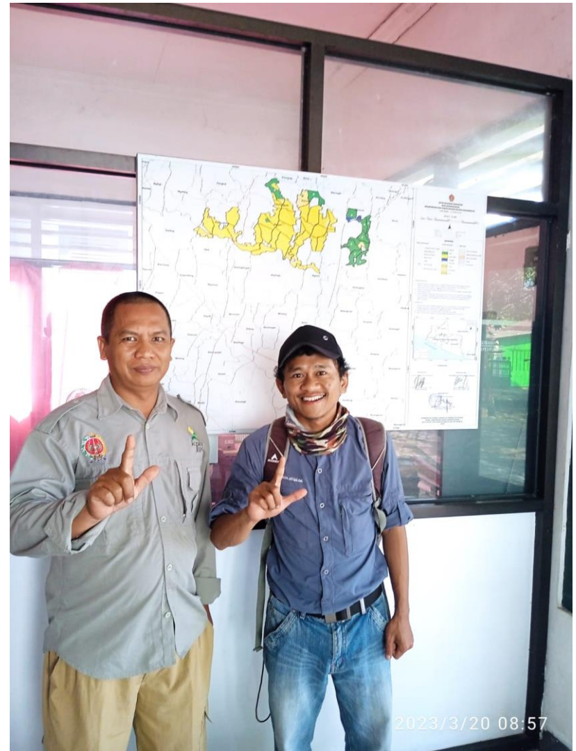
Gambar 14. Peneliti Bersama Kepala BDH Karangmojo