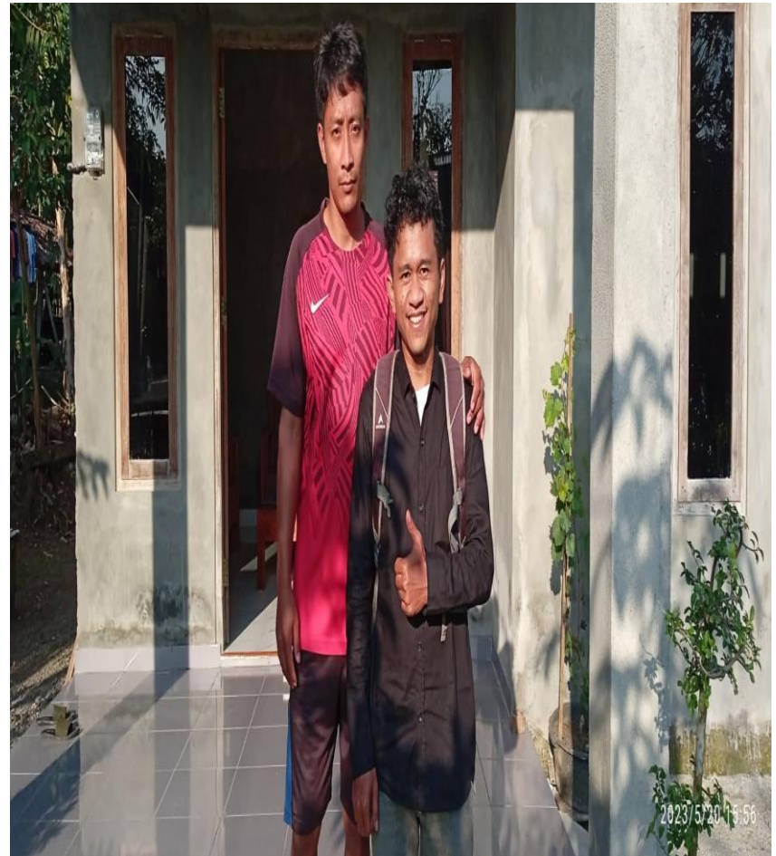
Gambar 10. Peneliti Bersama Ketua HKm Wonorejo