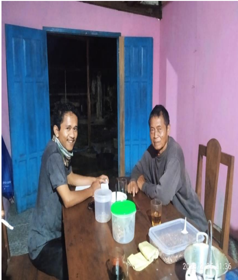
Gambar 9. Peneliti Bersama Responden