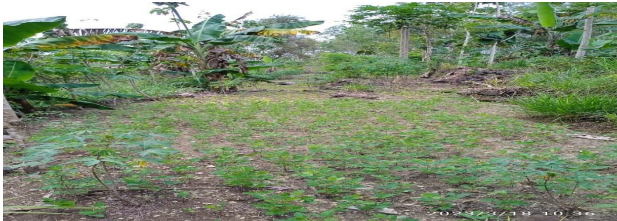
Gambar 13. Tanaman Jati dan Palawija