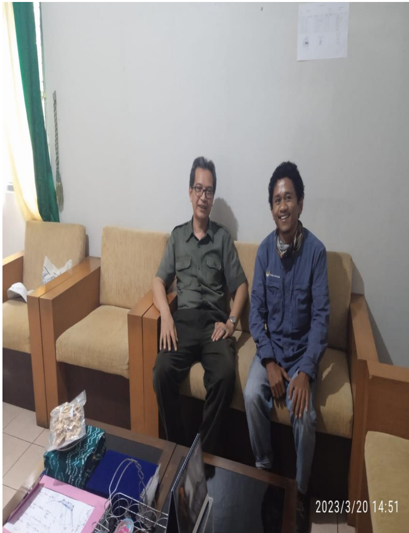
Gambar 13. Peneliti Bersama Kepala Balai KPH