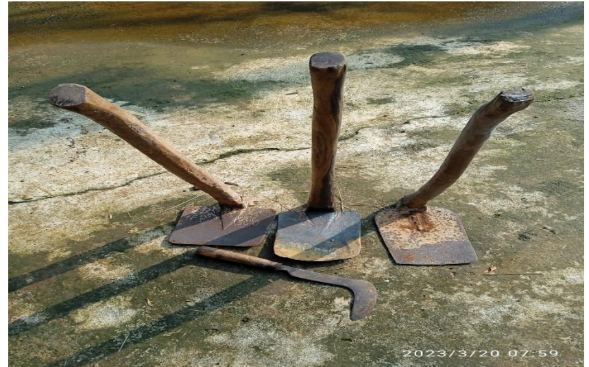
Gambar 12. Cangkul dan Sabit