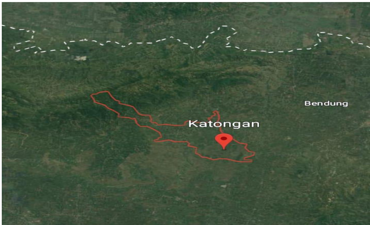
Gambar.3 Peta Kelurahan Katongan