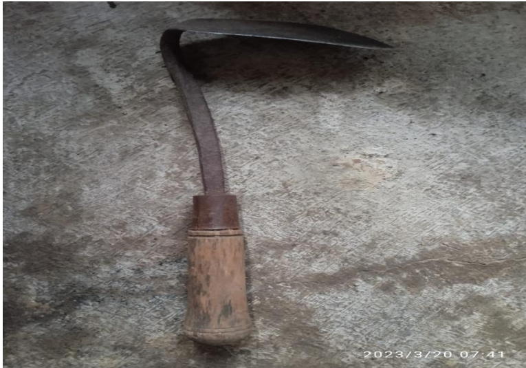
Gambar 11. Cekeran