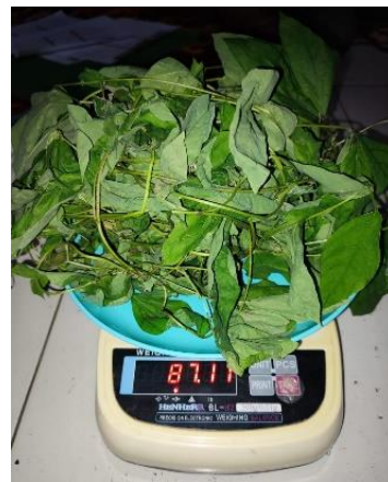
Berat Segar Tajuk