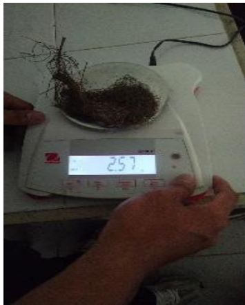
Berat Kering Akar