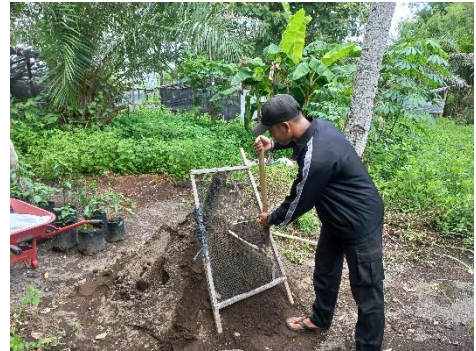
Pengayakan Media Tanam