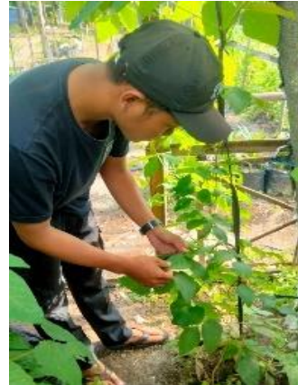
Pengukuran Jumlah Daun