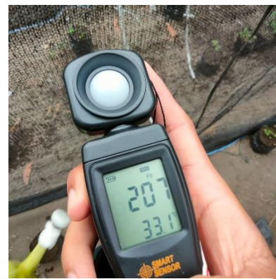
Pengukuran Intensitas Cahaya