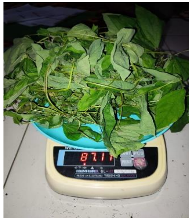
Berat Basah Tanaman