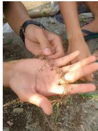
Perhitungan Bintil Akar