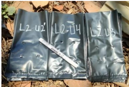
Pemberian Label Pada Polibag