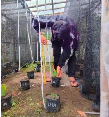
Pengukuran panjang sulur