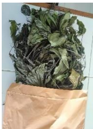
Berat Kering Tajuk