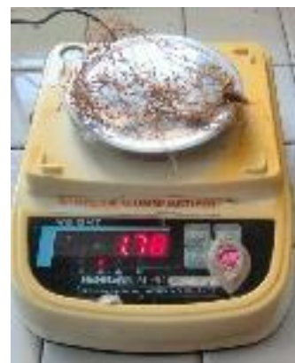
Berat Segar Akar