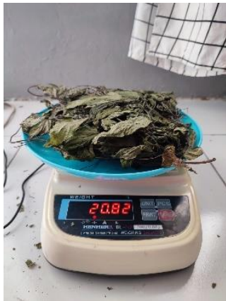
Berat Kering Tanaman