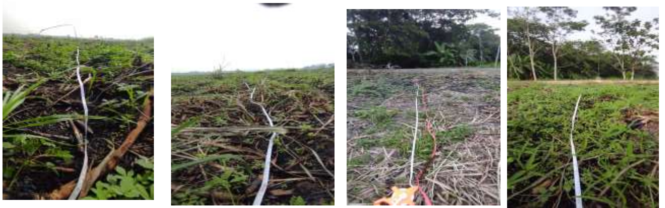
Metode pengambilan sampel di kebun tebu umur 11 bulan