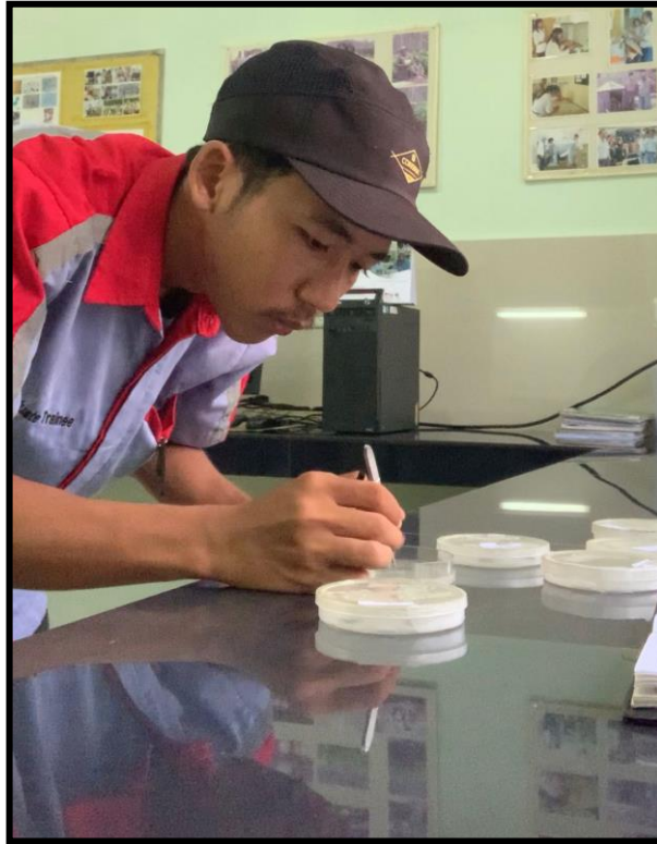
Lampiran 10. Pengamatan patogen yang ada pada sampel daun yang bergejala melalui mikroskop