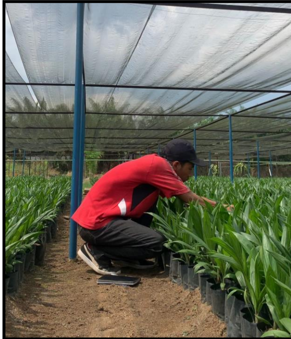
Lampiran 4. Pengambilan sampel di main nursery