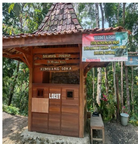
Gambar 3. loket pembelian tiket