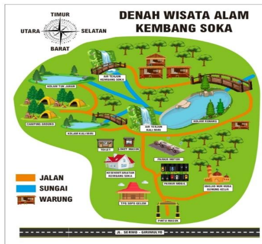
Gambar 1. Denah wisata kembang soka