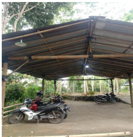
Gambar 6. Tempat parkir