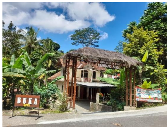
Gambar 2. Pintu masuk ekowisata