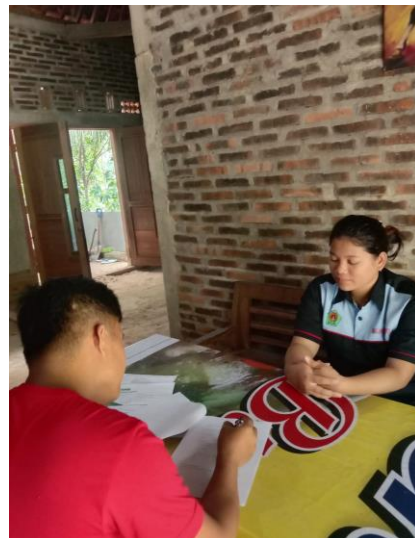
Gambar 7. Masyarakat mengisi kuisisioner