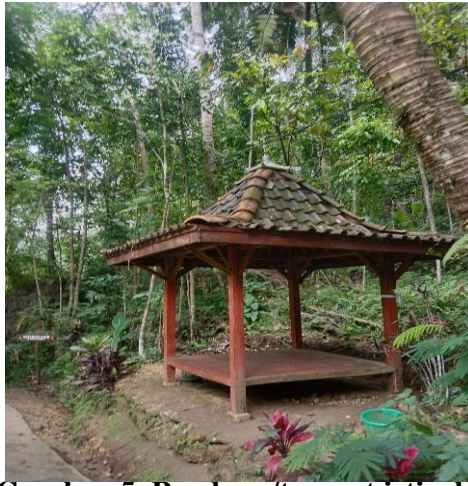
Gambar 5. Pendopo/tempat istirahat