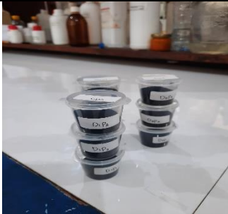
Sampel nilai kalor