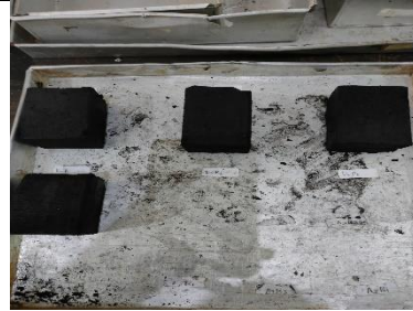
Briket yang dicetak