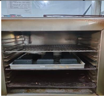
Briket yang udah kering