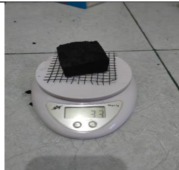
Arang ditimbang untuk L,pembakaran