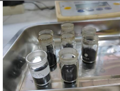
Sampel analisis kadar air