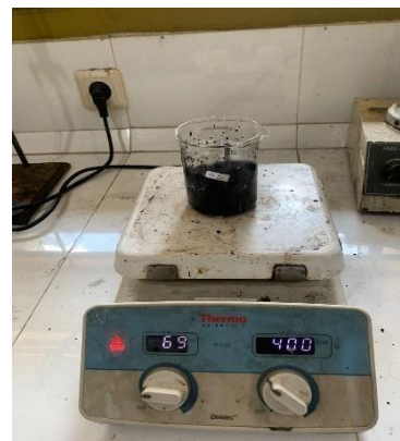
Proses mixing tinta