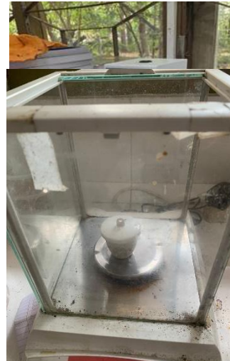
Uji kadar abu