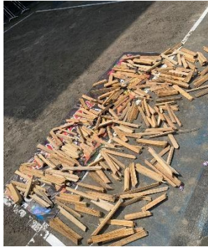
Penjemuran pelepah sawit