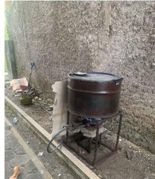
Pengarangan pelepah sawit