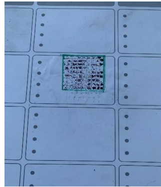
Uji daya adhesi