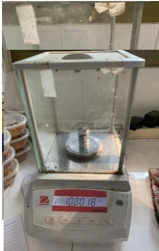
Uji kadar air