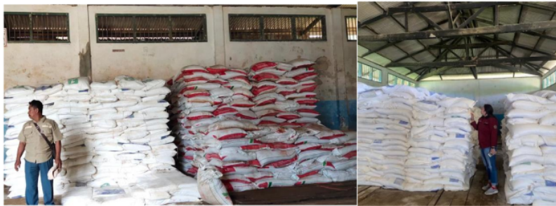
Gambar 5.3 Kondisi Penyimpanan Barang Di Gudang Kebun PT Surya Agrolika Reksa

Berikut ini kondisi penyimpanan barang di Gudang kebun PT. Surya Agrolika Reksa :