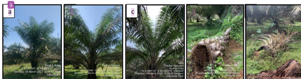
Gambar 1. Gejala serangan penyakit busuk pangkal batang pada kelapa sawit. a. Tanaman dengan daun muda lebih kerdil dari tanaman sehat, b. Tanaman dengan daun tombak tidak mekar, c. Tanaman dengan pelepah tua kering dan patah, d. Tanaman tumbang, e. Tanaman mati.