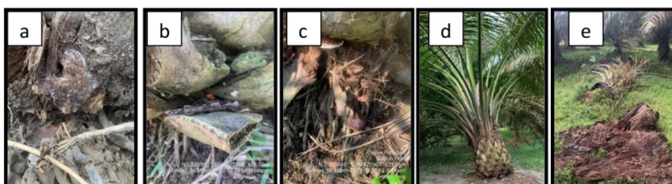
Gambar 2. Gejala penyakit busuk batang basal Ganoderma di lapangan: a). Munculnya miselium. b). Tubuh buah Ganoderma mulai muncul c). Tubuh buah sudah muncul dan menyebar d). Pembusukan pada batang basal e). Pembusukan 80-90 % pada batang basal.

Pada tanaman yang terserang penyakit BPB dengan gejala ringan terlihat badan buah Ganoderma mulai muncul (Gambar 2a). Tubuh buah Ganoderma mulai berkembang dan menyebar ke seluruh bagian batang bawah kelapa sawit (Gambar 2b). Tanaman kelapa sawit tumbang akibat serangan Ganoderma (Gambar 2c) terdapat lubang pada batang basal (Gambar 2d). dan pada akhirnya tanaman mati hingga membusuk (Gambar 2e).