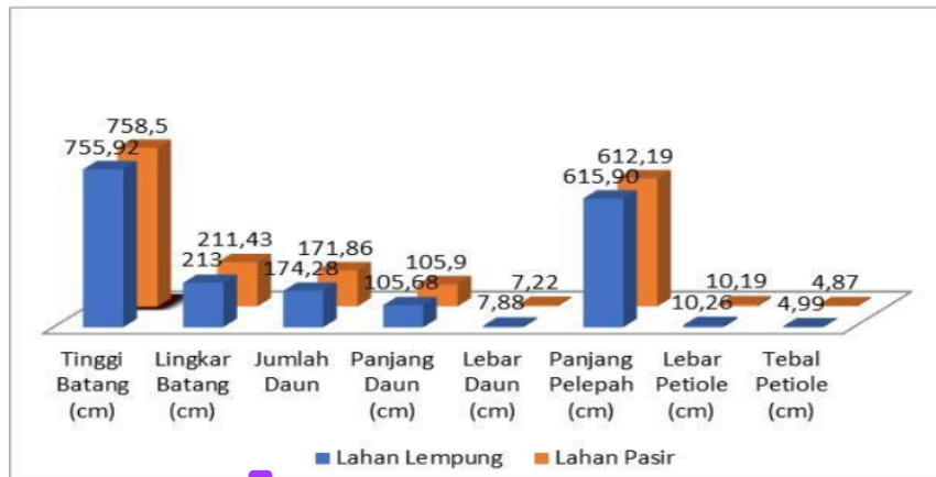
Gambar 4. Karakter agronomi tanaman kelapa sawit pada tanah lempung dan pasir tahun 2023.

Gambar 4 menunjukkan karakter agronomi yang merupakan tingkat pertumbuhan vegetatif tanaman kelapa sawit pada tanah lempung dan tanah pasir yang diberi tandan kosong mempunyai beberapa perbedaan nyata. Tinggi batang pada tanah pasir lebih tinggi dengan selisih sebesar 2,58 cm dibandingkan pada tanah lempung. Lingkar batang, jumlah daun, panjang daun dan tebal petiole pada tanah lempung lebih tinggi dengan selisih masing-masing sebesar 1,57 cm, 2,42, dan 0,12 cm. Panjang daun, lebar daun, dan panjang pelepah pada tanah lempung dan pasir menunjukkan pengaruh yang sama.