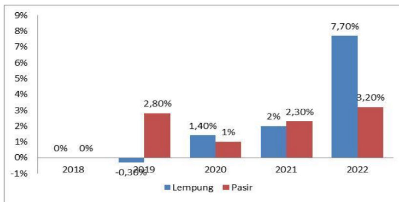
Gambar 3. Kenaikan dan penurunan Tandan/ha tahun 2018 – 2022

Tabel 3 menunjukkan rerata jumlah tandan/ha tahun 2018 – 2022 pada tanah lempung dan pasir menunjukkan tidak berbeda nyata, dengan kenaikan jumlah tandan/ha pada setiap tahunnya berkisar antara 1,4 – 7,7 %, kecuali tahun 2019 menunjukkan penurunan sebesar 0,3 % pada tanah lempung, sedangkan pada tanah pasir menunjukkan kenaikan jumlah tandan/ha pada setiap tahunnya antara 1 – 3,2 %.