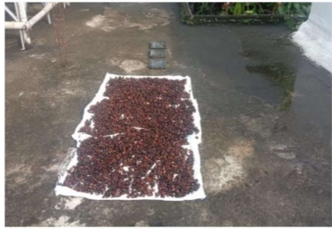
Penjemuran Kulit Kopi