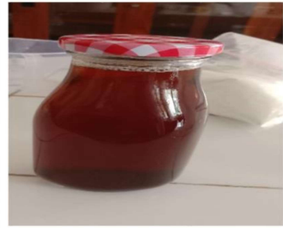
Penyeduhan Kulit Kopi