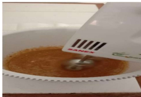
Proses Pembuatan Minuman Serbuk