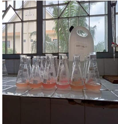
Uji Total asam