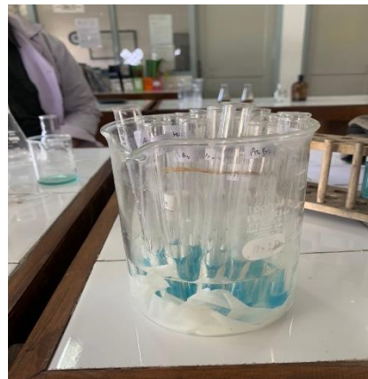
Uji Gula reduksi