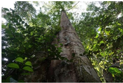
(c). Shorea smithiana (Mahambung)