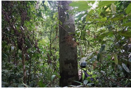
(a). Shorea parvifolia (Meranti Merah)