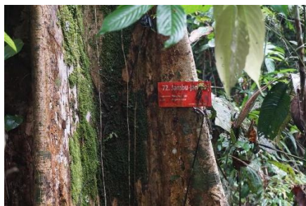
(e). Syzygium spp. (Jambujambu)