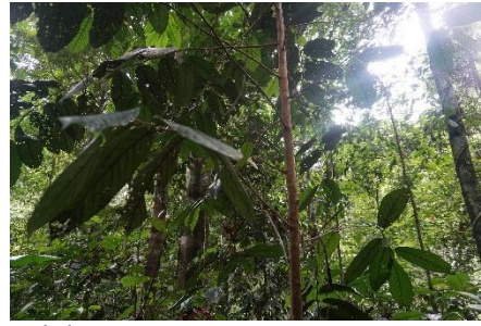
(b). Euzyderoxylon zwageri (Ulin)