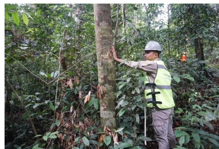
(f). Memecylon sumatrense (Kamasulan)