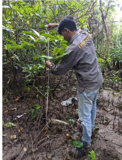
Pengukuran tinggi pohon menggunakan pita ukur