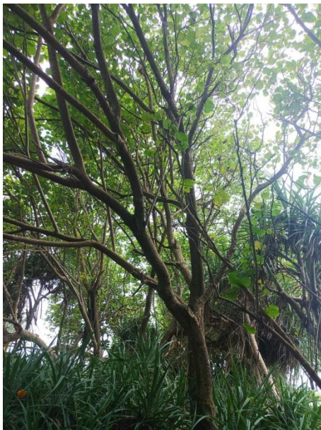
Waru Laut ( Thespesia Populnea )