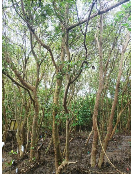
Api-api putih ( Avicennia Marina )