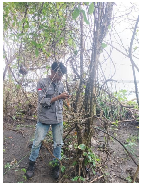
menandai titik koordinat setiap plot