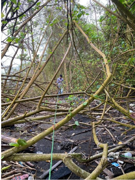
Penarikan tali guna membuat plot