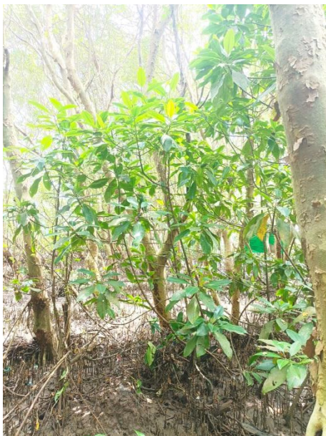
Lenggadai ( Bruguiera Plaviflora )