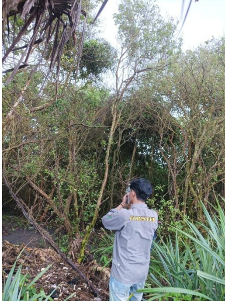
Pengukuran tinggi pohon Menggunakan Hagameter