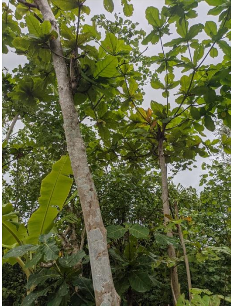
Ketapang ( Terminallia catappa )