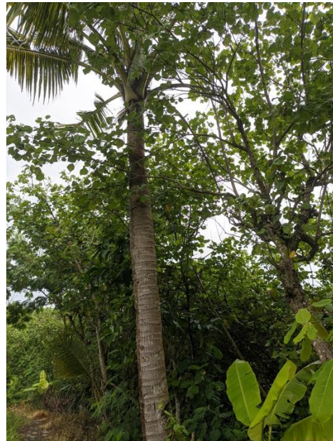
Kelapa ( Cocos Nucifera L. )