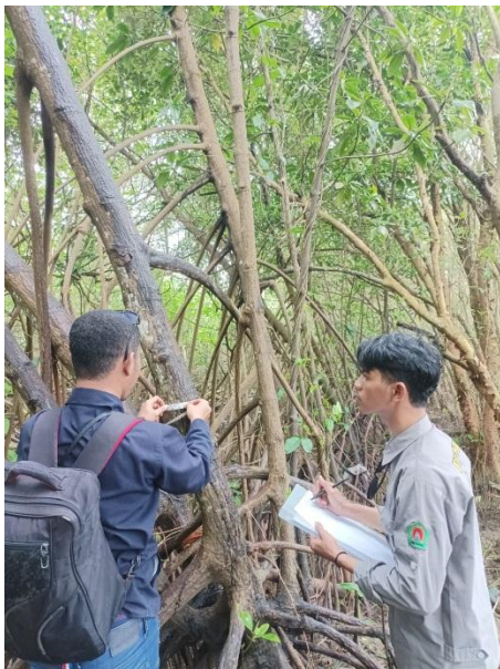
Pengukuran diameter batang