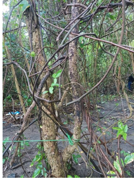
petak plot pengamatan menggunakan tali