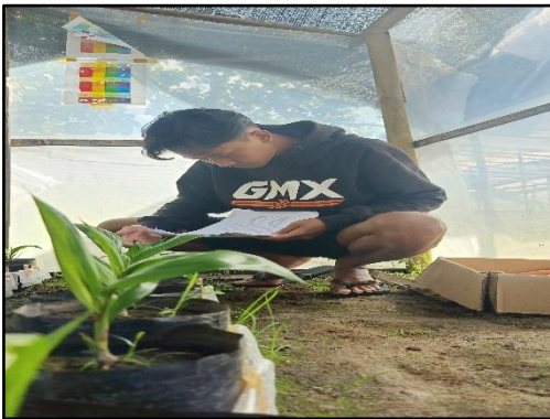
Menghitung jumlah daun