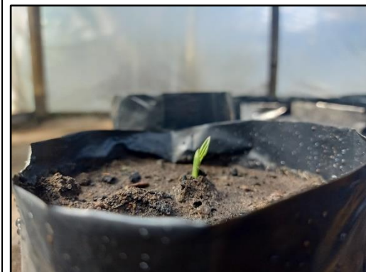
Seminggu setelah penanaman