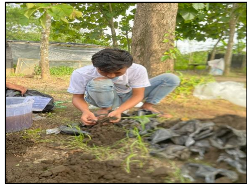
Proses pemanenan bibit kelapa sawit