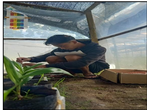
Mengukur tinggi tanaman