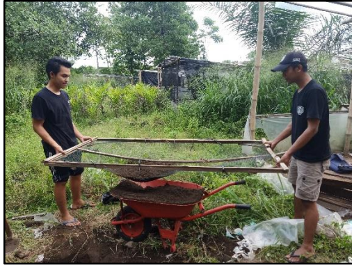
Mengayak media tanam