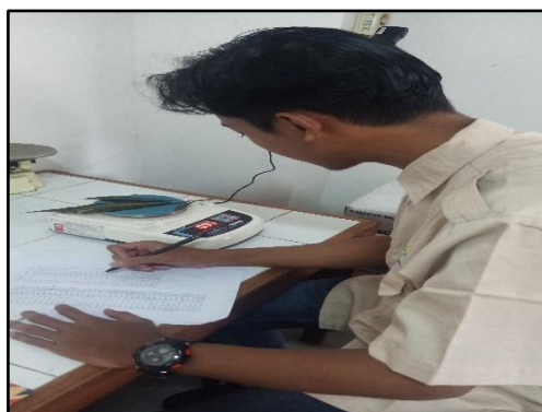
Menimbang berat kering tajuk