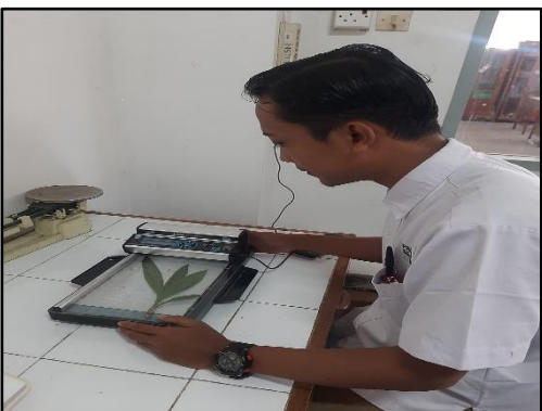
Mengukur luas daun