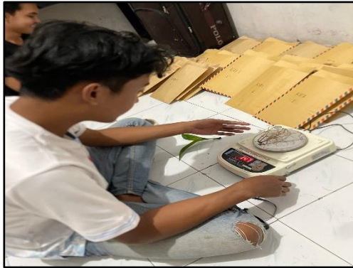
Menimbang berat segar akar