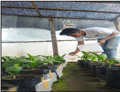
Mengaplikasikan POC urin ternak