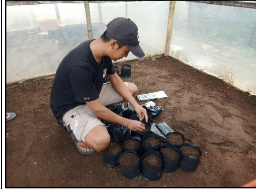
Memasukan tanah ke dalam polybag