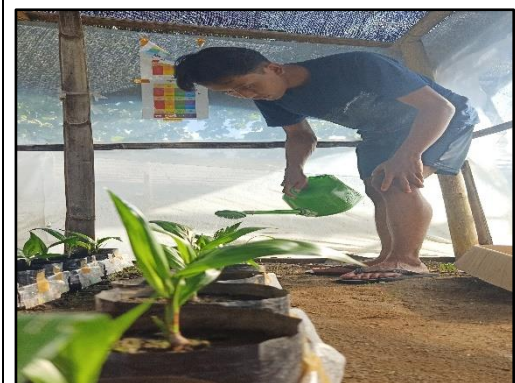
Menyiram bibit kelapa sawit