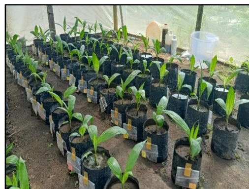
Dua bulan setelah penanaman