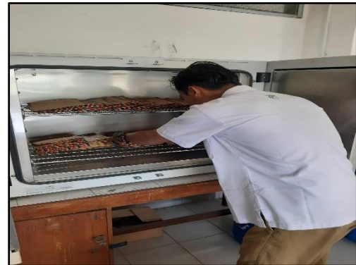
Mengoven bbit kelapa sawit