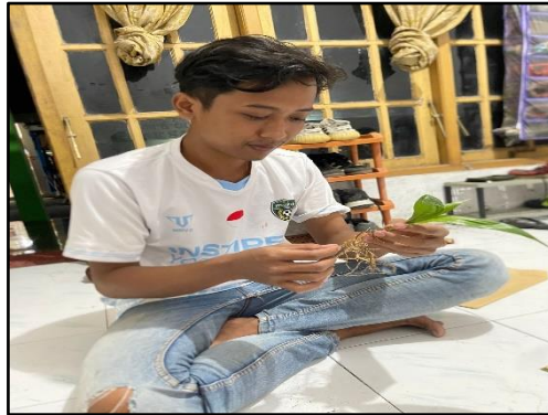
Menghitung jumlah akar primer