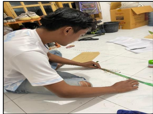
Mengukur panjang akar