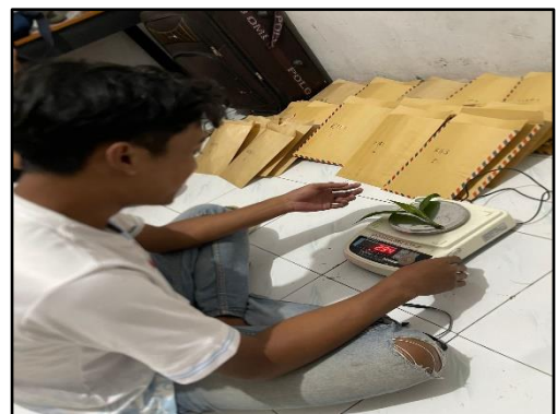
Mnimbang berat segar tajuk