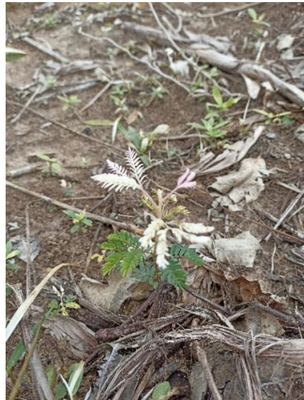
Putri malu ( Mimosa sp )