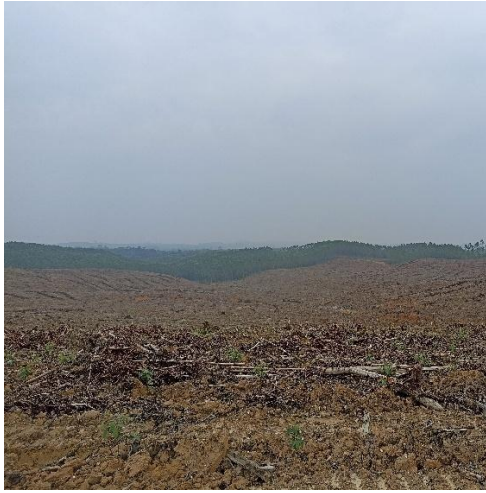
Tipe Kelerengan Datar