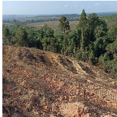
Tipe Kelerengan Sangat Curam