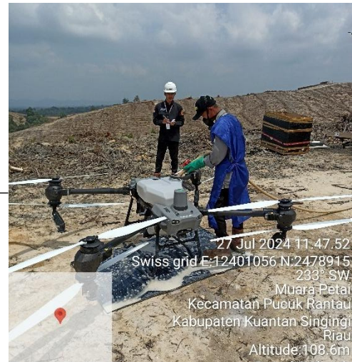
Pengisian Larutan Herbisida ke dalam Drone Sprayer