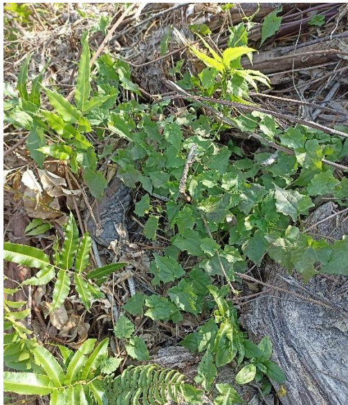
Gulma jahe-jahean ( Zingiberaceae )