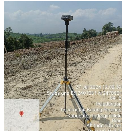
Real Time Kinematic (RTK) untuk mengumpulkan satelit drone