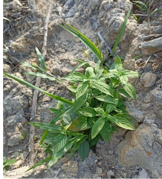
Gulma kentangan ( Borreria latifolia )