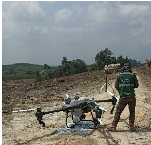
Penyemprotan Gulma dengan Drone Sprayer