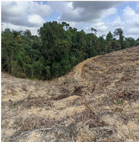
Tipe Kelerengan Curam