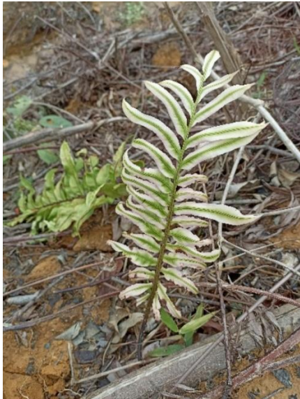
Paku pedang ( Nephrolepis biserrata )