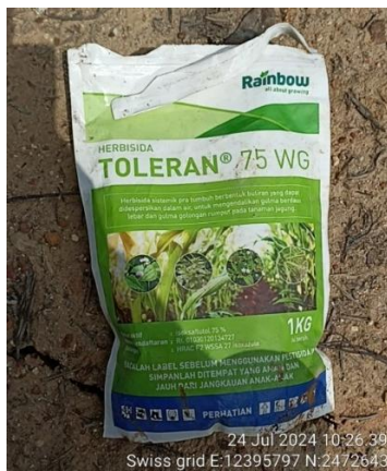
Herbisida merek Toleran 75 WG