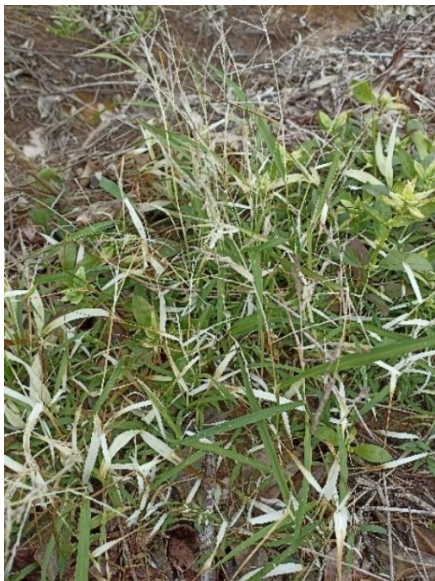
Gulma rerumputan ( Paspalum sp )