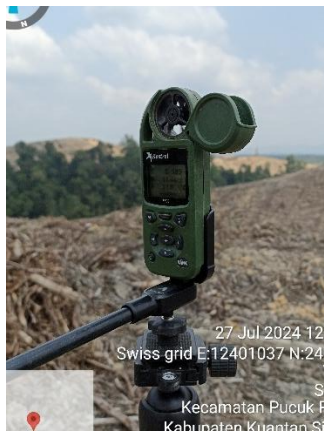
Kestrel untuk kecepatan angin, suhu dan kelembapan udara