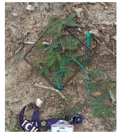
Patron untuk menilai gulma yang diamati