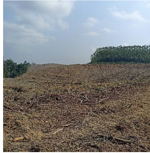
Tipe Kelerengan Landai