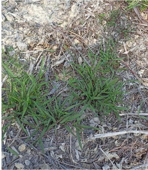
Gulma rerumputan ( Paspalum sp )