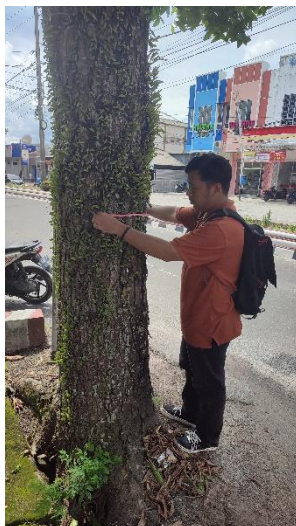
Mengukur keliling pohon