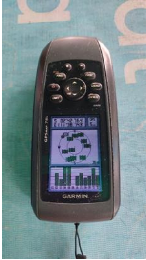
Global Positioning System (GPS)