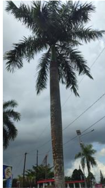
Palem ( Livistonia rotundifolia )