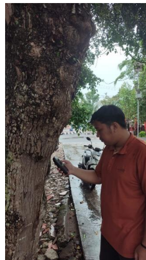
Menentukan koordinat pohon