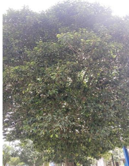
Tanjung ( Mimusops elengi )