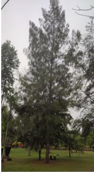
Cemara ( Casuarina sp )