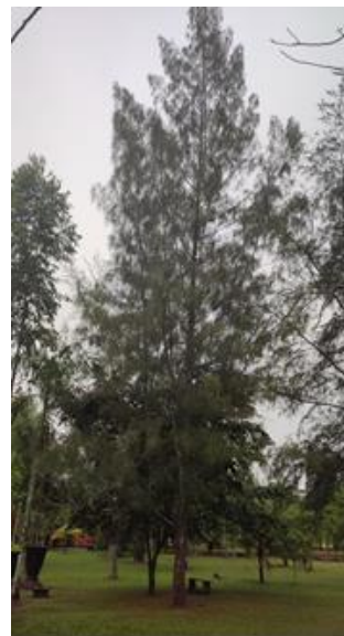
Cemara ( Casuarina sp )