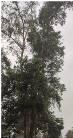
Akasia ( Acacia mangium )