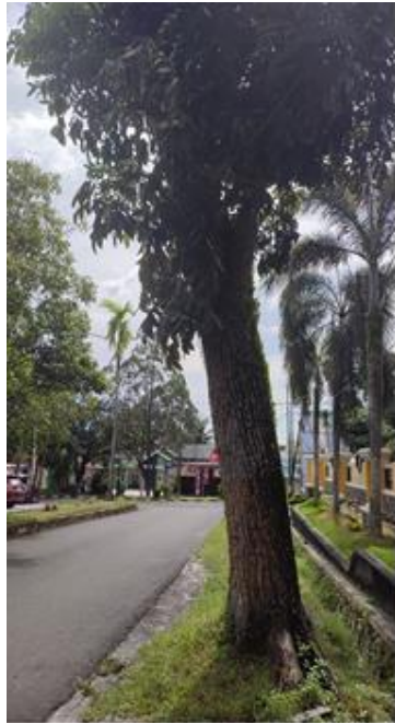
Mahoni ( Swietenia macrophylla )