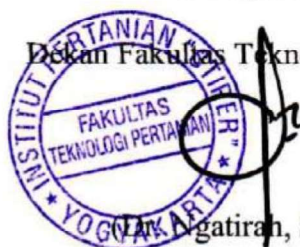
(Lark Agatirah, SP, MP)