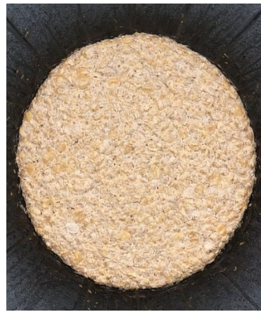
Fermentasi ampas tahu dan tempe