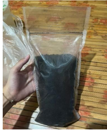
Persiapan bahan media tanam dan bibit kelapa sawit