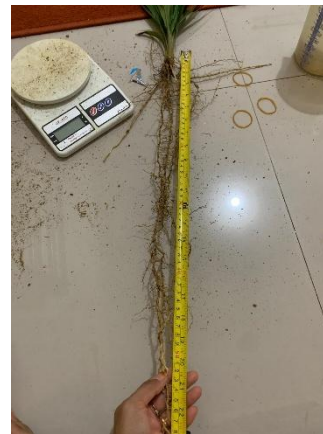
Proses pengukuran parameter penelitian