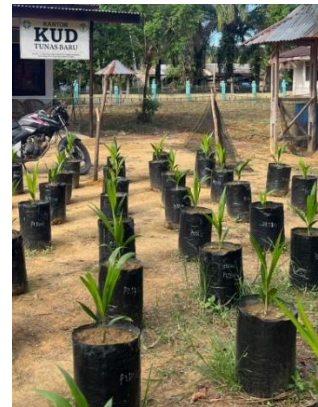
Aplikasi Bahan Organik dan Trichoderma sp. pada bibit kelapa sawit