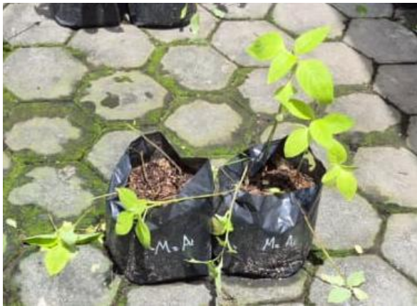
Lampiran 8 Gambar pengamatan 14 HSA