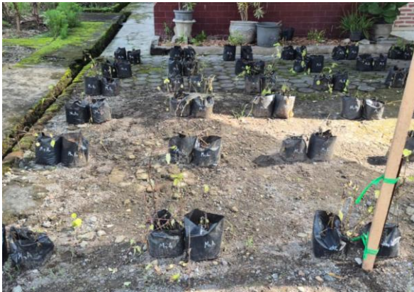
Lampiran 12 Gambar pengamatan 28 HSA