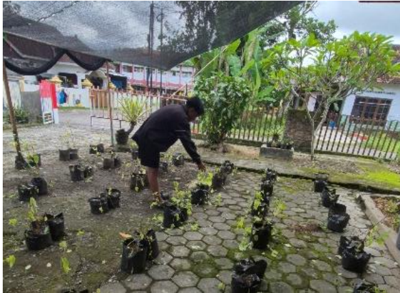
Lampiran 11 Gambar pengamatan 28 HSA