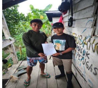
gambar 1. 3 wawancara dengan karyawan panen