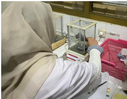
Uji Kadar Air