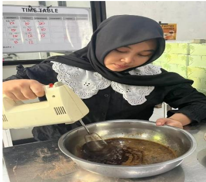
Pembuatan Brownies cookies Ulangan 1