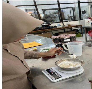
Pembuatan Brownies cookies Ulangan 2