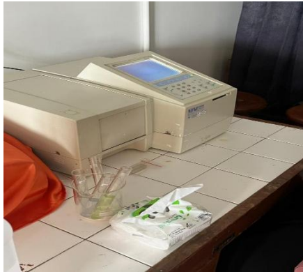
Uji Kadar Gula Total