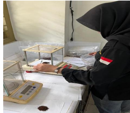
Uji Kadar Lemak