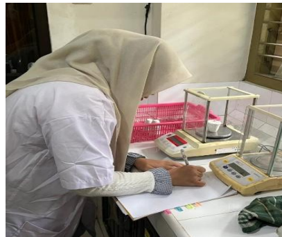
Uji Kadar Abu