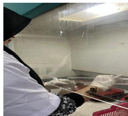
Uji Kadar Serat Kasar